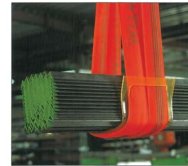
Kantenschutzplatte aus Polyurethan, zäh und anschiessam. Diverse Größen lieferbar.