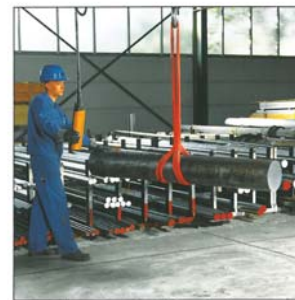
Fest im Griff auch mit einzelner Schlinge: Anschlagart einfach geschnürt