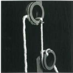
Rohstoffprüfung durch permanente Kontrolle der höchsten Polyesterfasern.