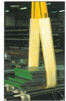
Schutzschlauch aus Polyurethan*, schnittfest 5 mm dick bei scharfen Kanten.