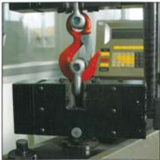
Festigkeitstest an Zubehörtteilen aus hochfestem Sonderstahl Güteklasse B. Bruchdehnung 25%, 4-fache Sicherheit.