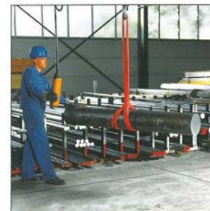
Fest im Griff auch mit einzelner Schlinge: Anschlagart einfach geschnürt