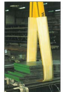
Schutzschlauch aus Polyurethan*, schnittfest 5 mm dick bei scharfen Kanten.