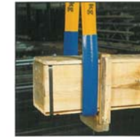
PVC-Schlauch als Abriebschutz auf rauen Flächen. Diverse Breiten, auch Meterware.