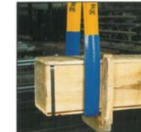
PVC-Schlauch als Abriebschutz auf rauen Flächen. Diverse Breiten, auch Meterware.