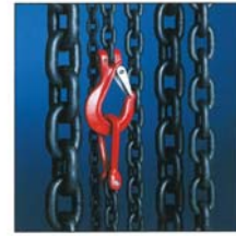
Ketten Anschlagketten Gütekl. 8 + 10 Rostfreie Edelstahlketten, Hebezeugketten DIN-Ketten aller Art