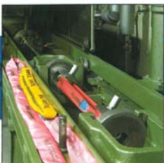
Ganzerreissprobe an fertigen Rundschlingen als Endkontrolle. 7-fache Sicherheit. Prüflast bis zu 80 Tonnen.