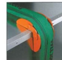
Kantenschoner mit Magnethaltung aus Alu-Guss für Hebebänder und Schlingen bis 80 bzw. 150 mm.

* Schläuche aus 5 mm Polyurethan sind nur in den Anordnungen A) und B) möglich.