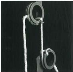
Rohstoffprüfung durch permanente Kontrolle der höchsten Polyesterfasern.