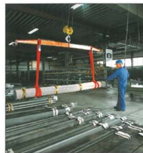
Schonender Transport dünner Stangen mit 2 Rundschlingen, einfach geschnürt