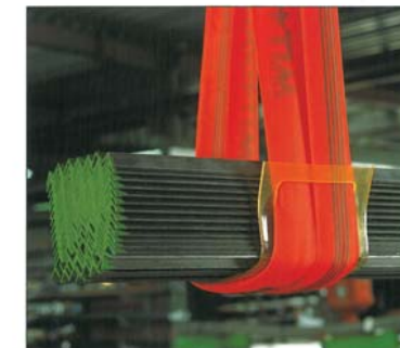
Kantenschutzplatte aus Polyurethan, zäh und anschmiegsam. Diverse Größen lieferbar.