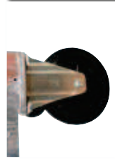
4 Transporträder - 2 mit Feststellbremse