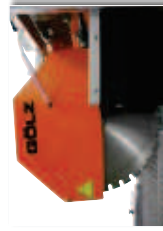
Scheibendurchmesser 650 mm (260 mm Schnitttiefe)