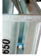
Herausnehmbare, verzinkte Wasserwanne

Schnittlänge 500 mm Blatt-Ø 650 mm Schnitttiefe 260 mm